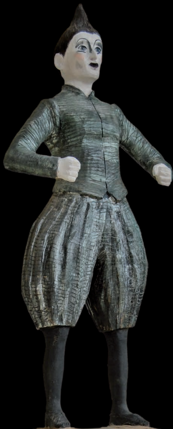
»Boy« (#1088) H: 174 cm, 2014 Holz, farbig gefasst