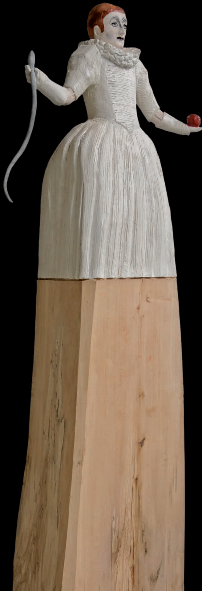
»Lady/Eve« (#1091) H: 175 cm, 2015 Holz, farbig gefasst