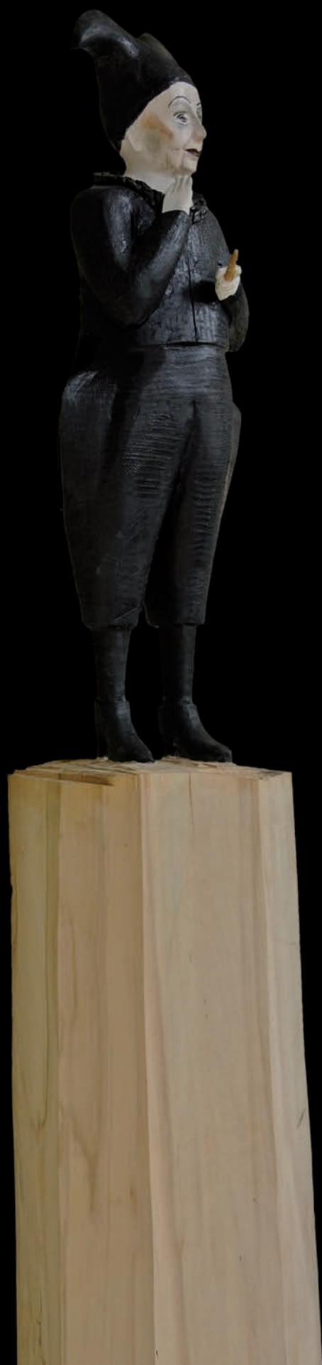
»Fool« (#1083) H 164 cm, 2015 Holz, farbig gefasst