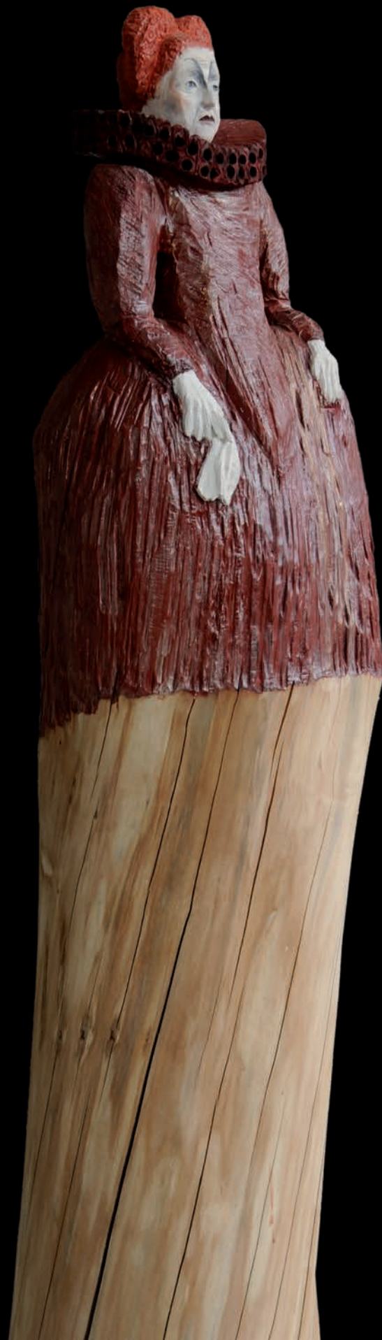
»Elisabeth« (#1085) H: 165 cm, 2014 Holz, farbig gefasst