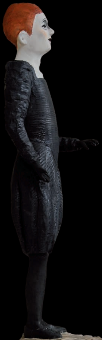
»Gentleman/Lady« (#1092) H: 166 cm, 2015 Holz, farbig gefasst