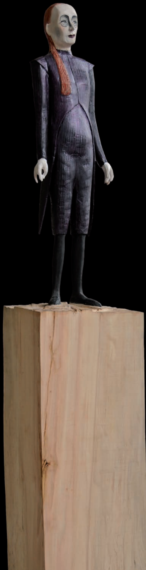
»Secretary« (#1090) H: 174 cm, 2015 Holz, farbig gefasst