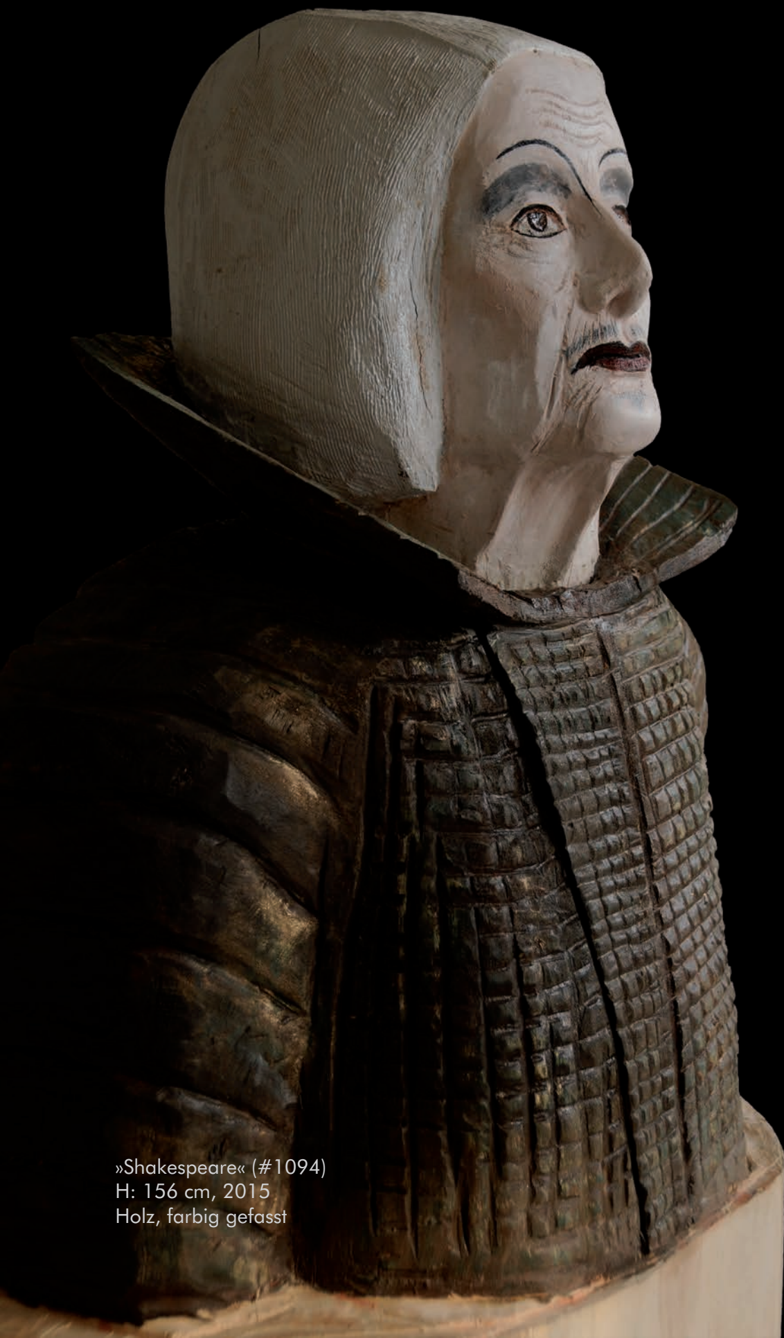
»Shakespeare« (#1094) H: 156 cm, 2015 Holz, farbig gefasst