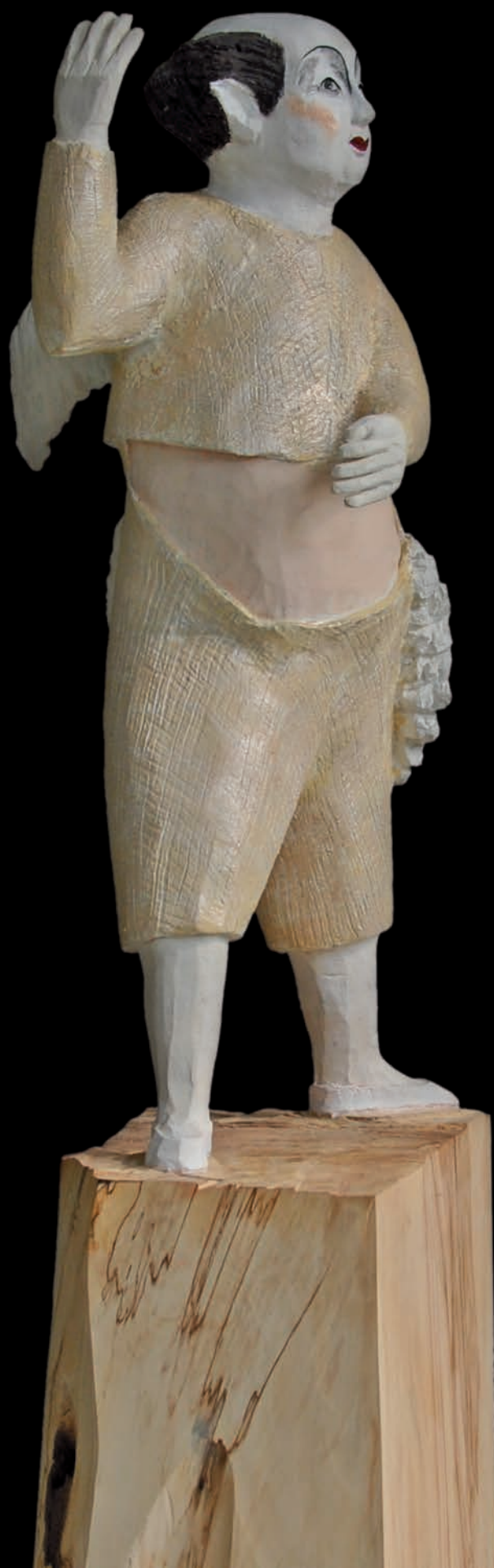
»Cupid« (#1086) H: 151 cm, 2014 Holz, farbig gefasst