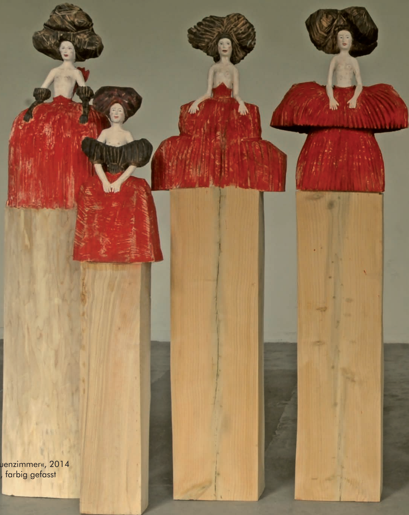
»Frauenzimmer«, 2014 Holz, farbig gefasst