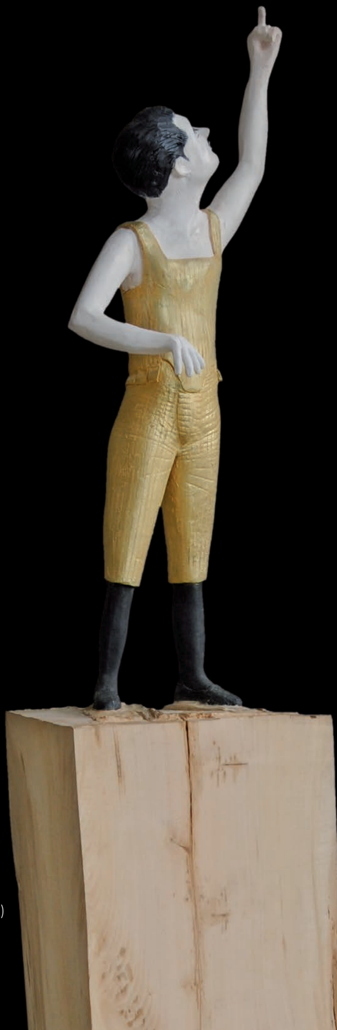
»Young Poet« (#1089) H: 167 cm, 2015 Holz, farbig gefasst