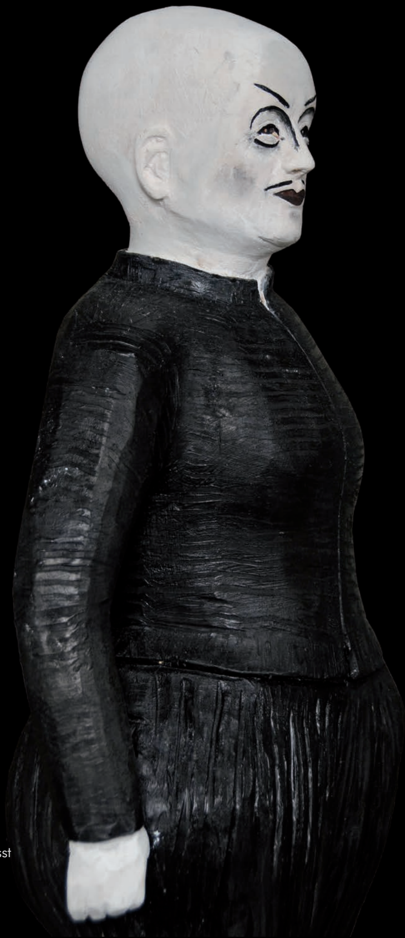
»Rival« (#1084) H: 166 cm, 2015 Holz, farbig gefasst