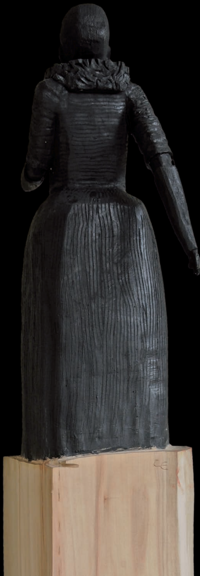
»Woman/Lady« (#1093) H: 170 cm, 2015 Holz, farbig gefasst