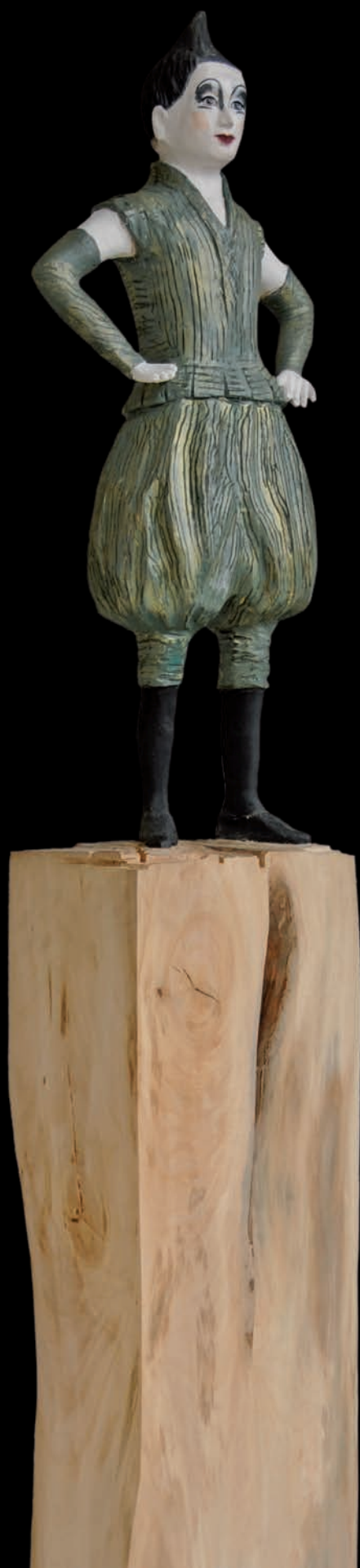
»Boy« (#1087) H: 173 cm, 2014 Holz, farbig gefasst